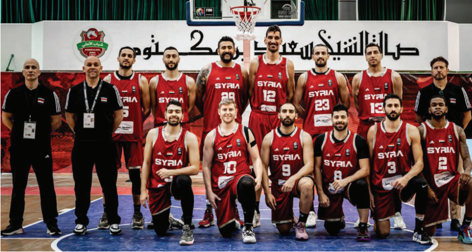
النافذة القادمة والمهمة.

نمني أنفسنا أن تكون هذه المشاركة موضع اهتمام القائمين على منتخبنا الأول، وخاصة أن لاعبيننا الوطنيين دخلوا في استراحة طويلة وهم بحاجة لتحضيرات مثالية تتناسب مع حجم وقوة مباريات النافذة، والمشاركة في بطولة المنتخبات تعتبر بمنزلة محطة امتحانية للجهاز الفني للمنتخب، وتجرب عدد كبير من اللاعبين، ومنهم اللاعب المجنس الذي سيتم تبديله بسبب إصابة اللاعب السابق، وعلى اتحاد السلة السعي لتأمين تكاليف هذه المشاركة، من أجل أن يؤمن فرصة احتكاكية للمنتخب قبل دخوله معترك النافذة القادمة.