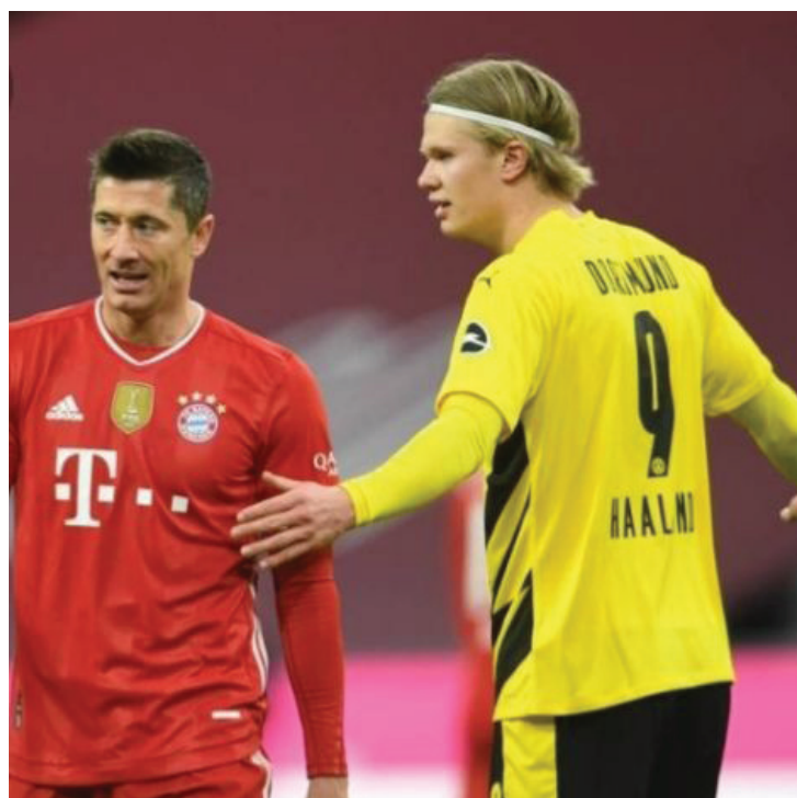
عزز بايرن ميونخ

وهبط ناديا غرويترفورت و أرمينيا بيلفيلد، ونجا هيرتا برلين بفوزه في مباراة فاصلة على هامبورغ صاحب المركز الثالث في دوري الدرجة الثانية وهو أحد أعرق الأندية الألمانية لكنه منذ هبوطه فشل في العودة لأضواء البوندسليغا، على حين صعد ناديا شالكه و فيردر بريمن وهما نادبان عريقان أيضاً في الدوري الألماني.